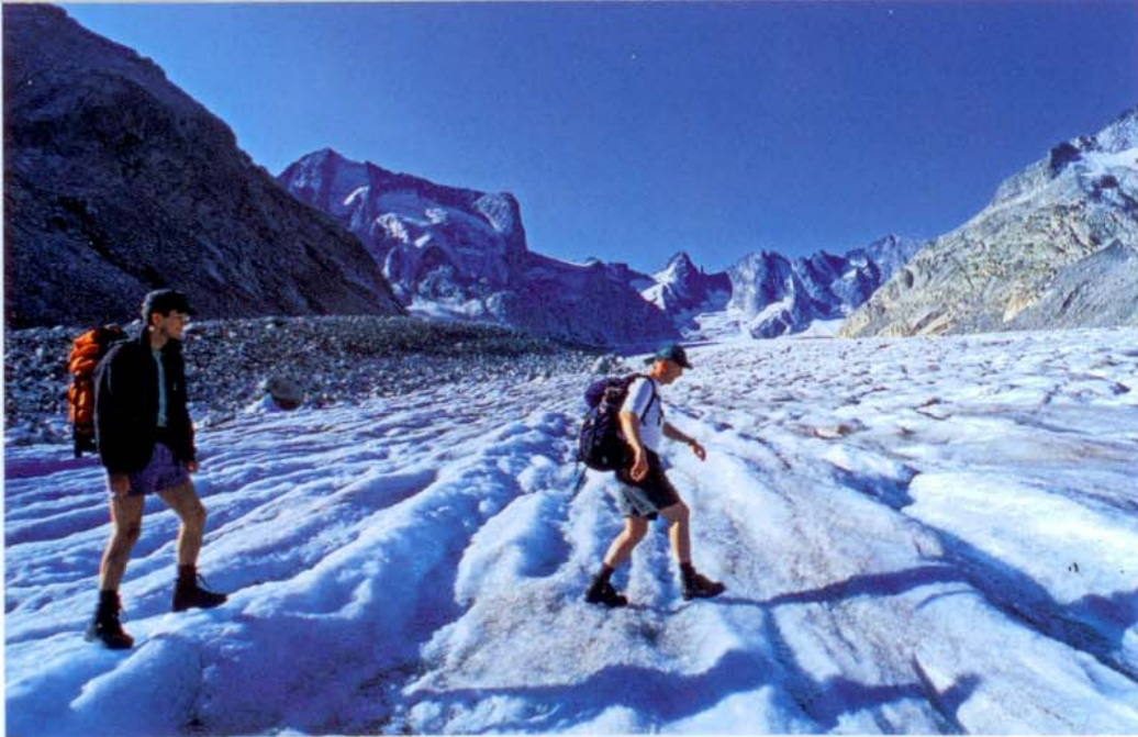
Beispiel T4: Auf dem Vadrec del Forno, zwischen Capanna del Forno CAS und Capanna da l'Albigna CAS (GR)

T4: Alpinwandern. Ein Wegtrassee ist nicht zwingend vorhanden, an gewissen Stellen braucht es die Hände zum Vorwärtskommen. Die Route führt über recht ausgesetzte Felsen, heikle Grashalden und/oder Schrofen. Ab dieser Schwierigkeit können auch sanfte Gletscher und Firnfelder vorkommen, die bei normalen Verhältnissen soweit ausapern,